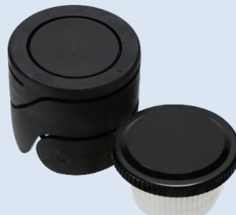
KK AZK-PT 黒 + 黒無地 BIO