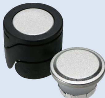
KK AZK-B 黒 + サテン銀無地BK BIO