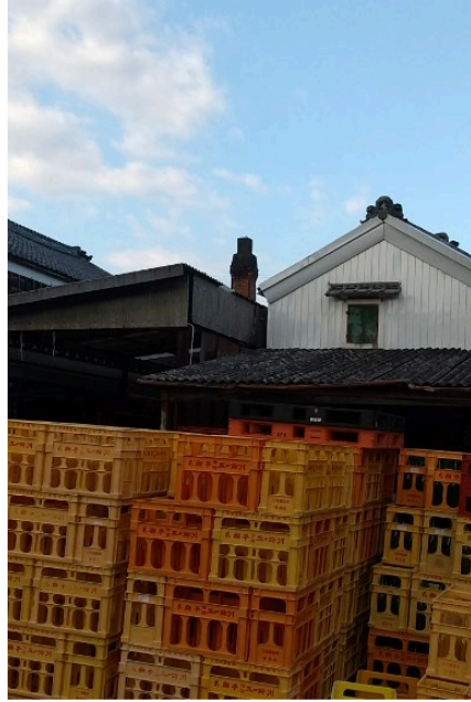
三重・元坂酒造「八兵衛」 t. iwayama