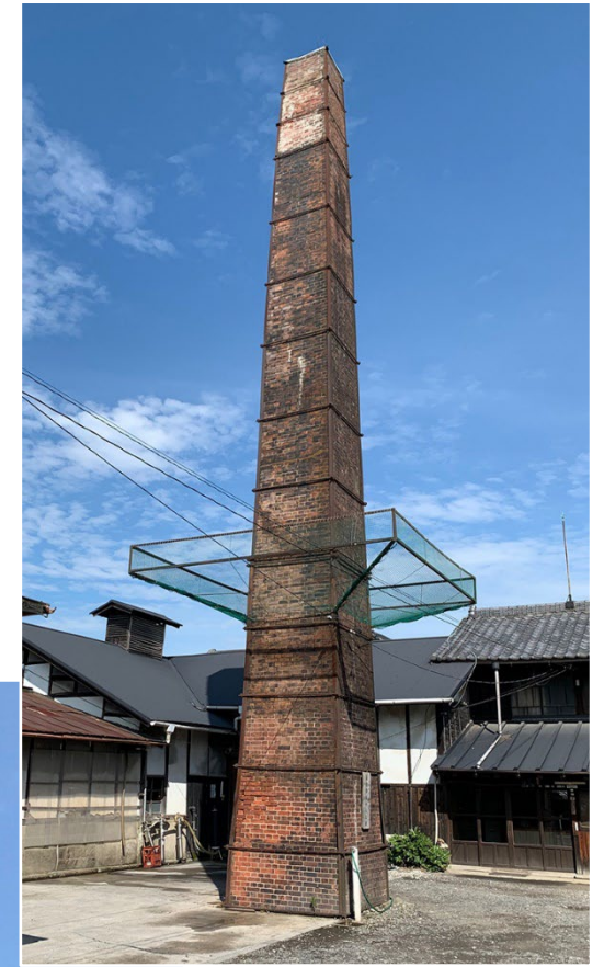
栃木・西堀酒造「若盛」 t.noda