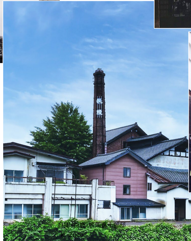
兵庫・白旗 赤馬嘉十郎 k. 2neo