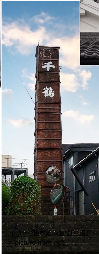
鹿児島・神酒造「千鶴」 ※左面に「いも神」→最初のページ t. harimoto