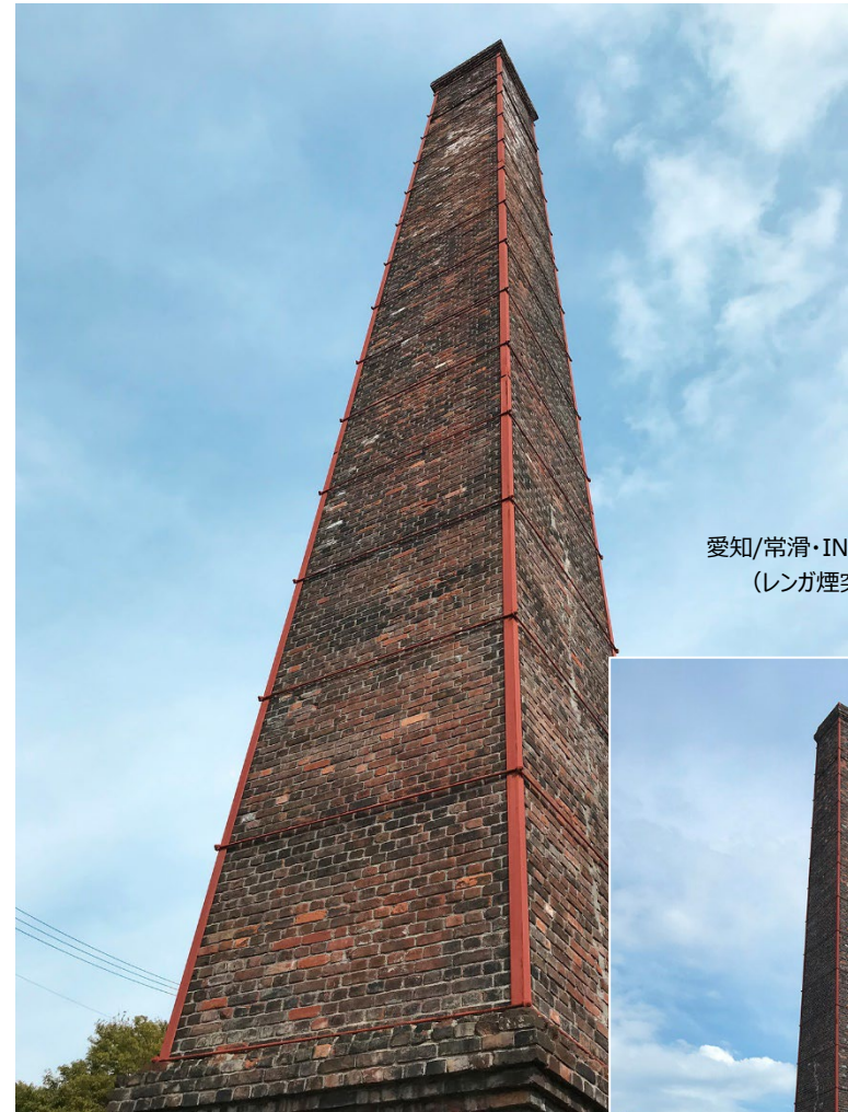
愛知/常滑・INAX ライブミュージアム (レンガ煙突で日本最大か?) k. 2neo