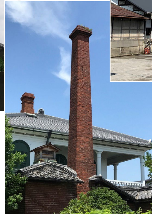
兵庫・白鹿・辰馬喜十郎邸 k. 2neo