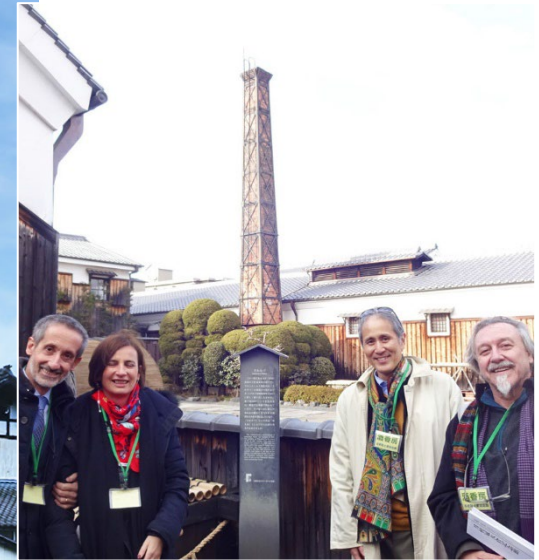
京都・月桂冠・大倉記念館 k. 2neo