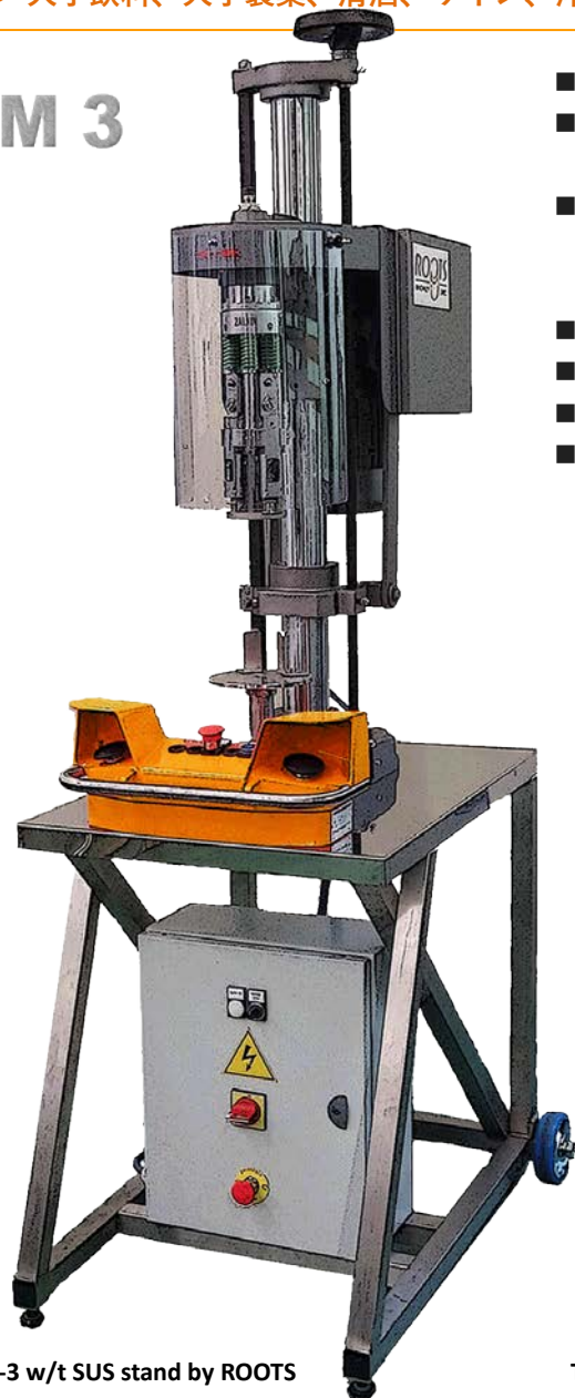
TM-3 w/t SUS stand by ROOTS