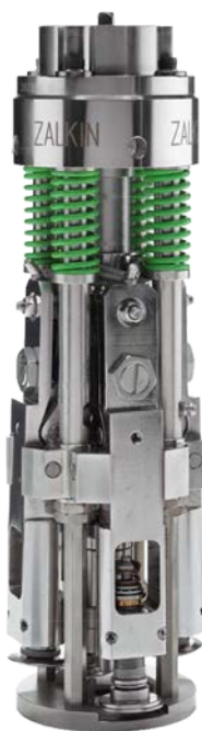
Type104 head (SUS)