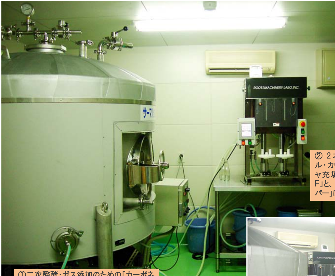
① 二次醗酵・ガス添加のための「カーボネーティングストーン付きサーマルタンク」(手前側面の大きなヘルール(3S)にセラミックストーンが装着されている)