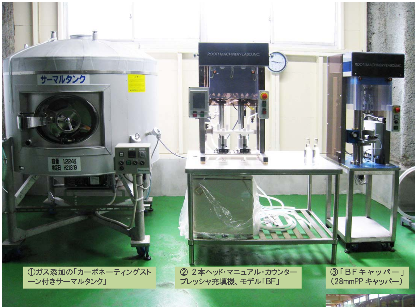
①ガス添加の「カーボネーティングス タン付きサーマルタンク」