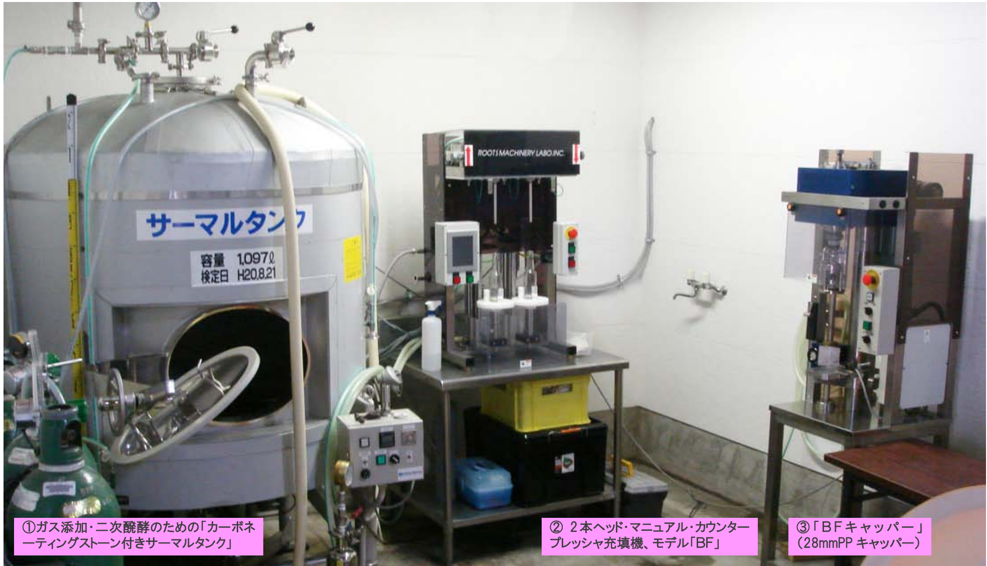
①ガス添加・二次醗酵のための「カーボネーティングストーン付きサーマルタンク」