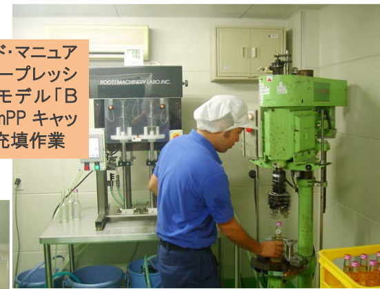
② 2本ヘッド・マニュアル・カウンタープレッシャ充填機、モデル「BF」と、「28mmPPキャップ」による充填作業