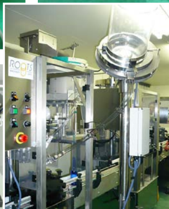
④ 1 ヘッド・マキシキャッパー(写真上: 28mmPP キャップの供給機と、写真左: キャッパーへ変更可能)