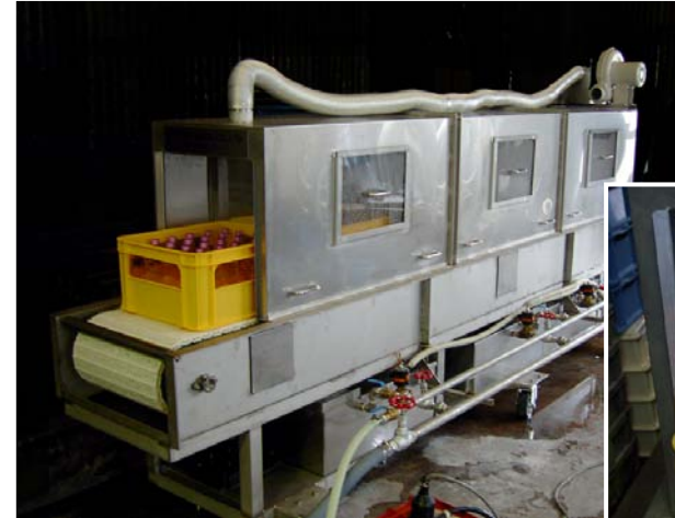
③ 小型トンネル・パストライザー(移動式) P箱のままパストライズ作業が可能