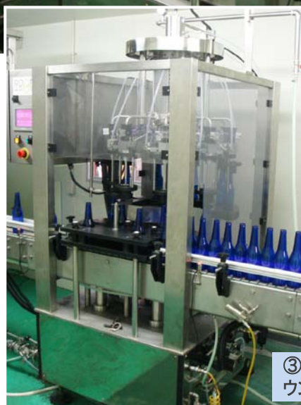
③ 9 ヘッド・ロータリー・カウンタープレッシャ充填機