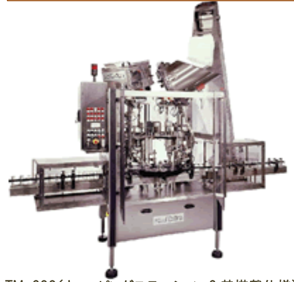
TM-200(キャッピングステーション 2 基搭載仕様)

写真は代表事例です。同じ機種でもご発注内容によって外観や仕様が変わることがあります。