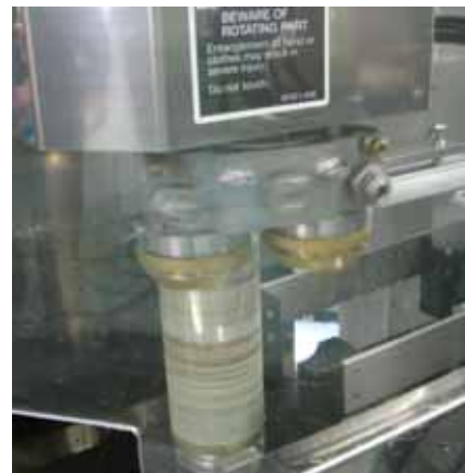
シーミングヘッド・アッセンブリー。1st ローラー、2nd ローラーが各1個。(ボトル缶のキャッパーも搭載可能です。)