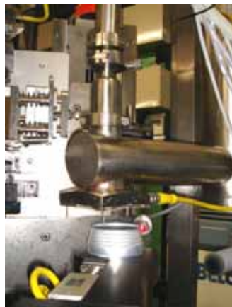
充填が終わった缶をスイングアームでつかんで、液体窒素滴下機の下をすばやく通過させる。写真は滴下の瞬間。