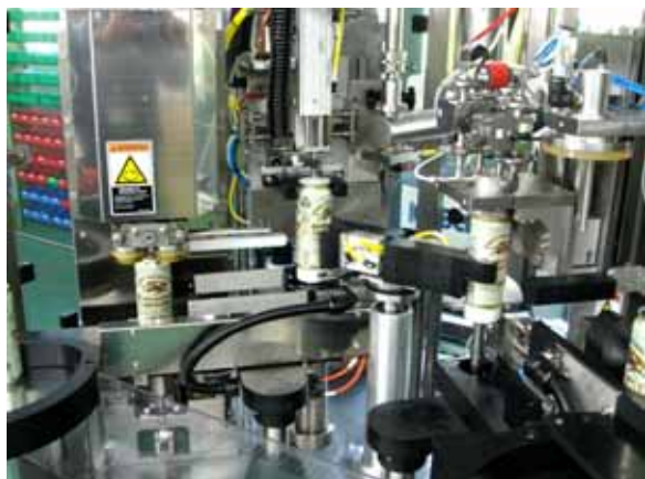
右端に少し見える缶の部分「エアリンス」工程、次が「カウンタプレッシャ充填」工程、次が「蓋のせとアンダーカバーガッシング」工程、左端が「蓋巻き締め」工程。(写真は「右投入 左排出」モデル)