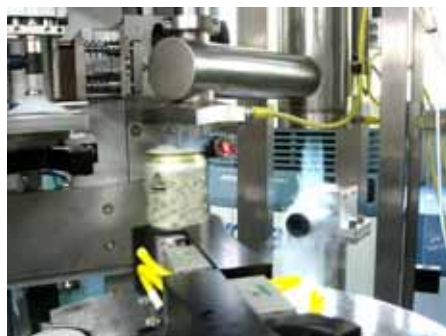
推奨仕様の VBC 社の滴下装置。液化窒素ボンベから「フレキシブルチューブ」で「滴下ヘッド」(上と右の写真。きわめてコンパクト)を連結するだけ。固定配管工事や窒素ガス配管は必要なく、簡単にセットアップ可能。「コントロールユニット」(左写真の中央)の操作もきわめてシンプル。(既存の滴下ヘッドを搭載することも可能です。最大許容ヘッドサイズ: 300mm)