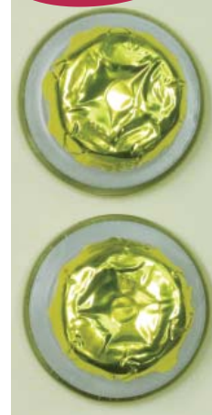
▲「ゴールドPET」スポット (PETの下に金色)