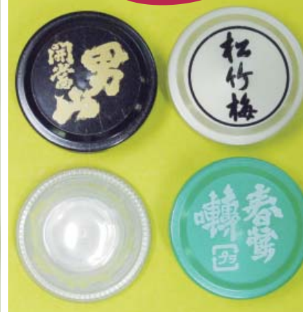
▲「透明PET」スポット (透明フィルムで無色。オールプラ替栓にのみ設定)

[PET スポット替栓とは?] 従来の1.8ℓびん用の替栓スポットアルミ箔は、接液部がエポキシやフェノールのコーティングですが、それをPETフィルムにおきかえたものです。