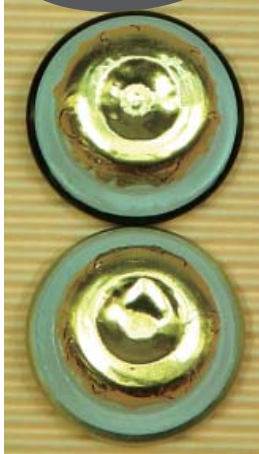
▲「金色アルミ」スポット (アルミに金色コート)