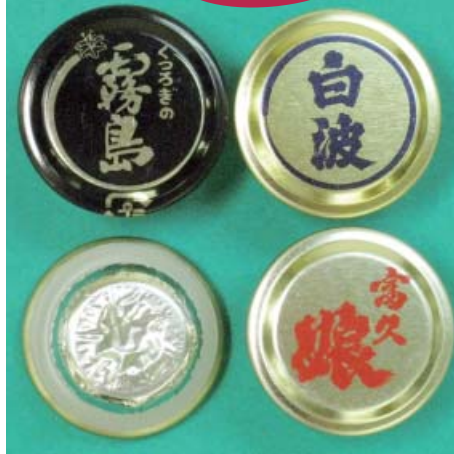
▲「シルバーPET」スポット (シルバー：着色無し。アルミの色)