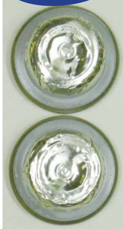
▲「薄金色アルミ」スポット (アルミに薄金色コート)