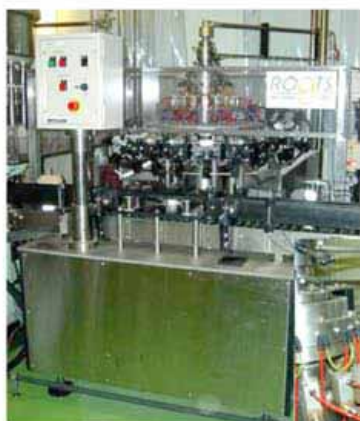
ガラス壺仕様の 倒立式 ロータリーリンサー (ルーツ機械研究所)