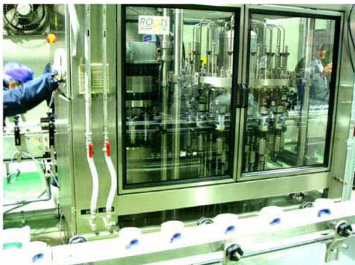
3000cph ビール缶詰め機 "SMB-ROOTS 15L/4S" (ドイツ SMB 社+ルーツ機械研究所)