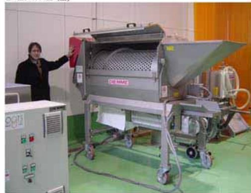
“除梗・破碎機” (イタリア DIEMME 社)