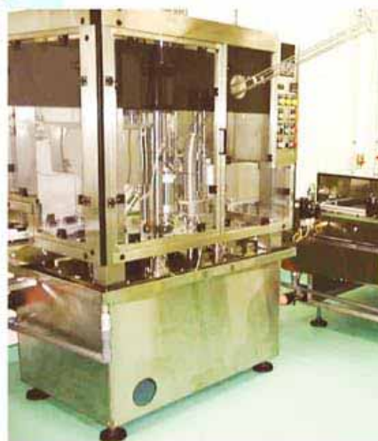
液体窒素滴下装置付きの清酒缶詰めライン "モノトロン 33-Series II" (ルーツ機械研究所)