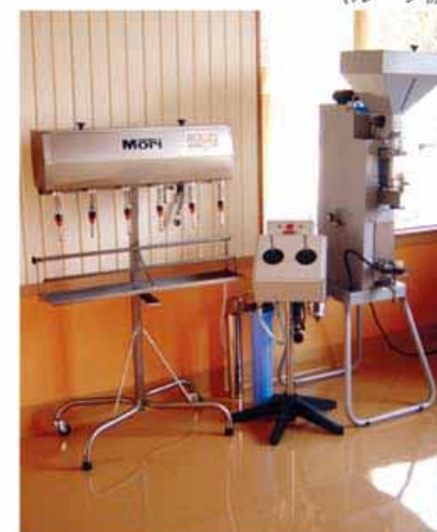
マニュアル充填の組合せ事例： 6本スパウトマニュアル充填機 (伊 Mori 社) リンサーバージャ (アメリカ TCW 社) バキューム装置付きコルカー (伊 e.mapan 社)