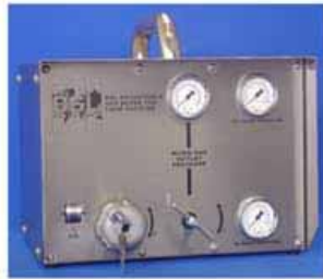
“炭酸・窒素ガス混合器” (英 BSL Gas Technologies 社)