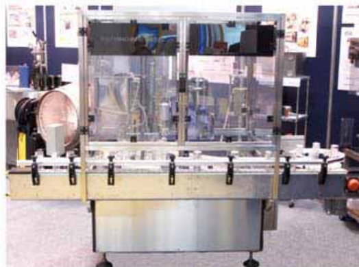
カップびん充填機 "モノトロン 33" (ルーツ機械研究所)