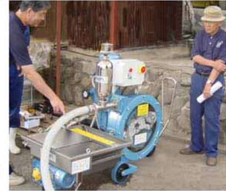
“チューブポンプ” (イタリア ragazzini 社)