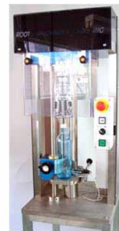
半自動 PP キャップ "BF キャップ" (ルーツ機械研究所)