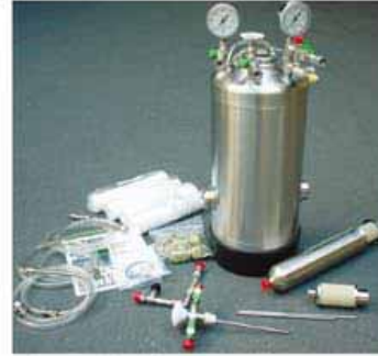
ガス飲料試作のための “パイロットプラント” (米 Zahm & Nagel 社)