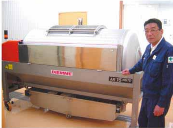
ワインの“メンブランプレス” (イタリア DIEMME 社)